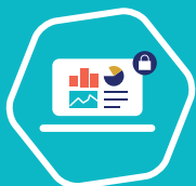
Tableau de bord du patient partagé et sécurisé.

Historique des INR, prescriptions et correspondances.